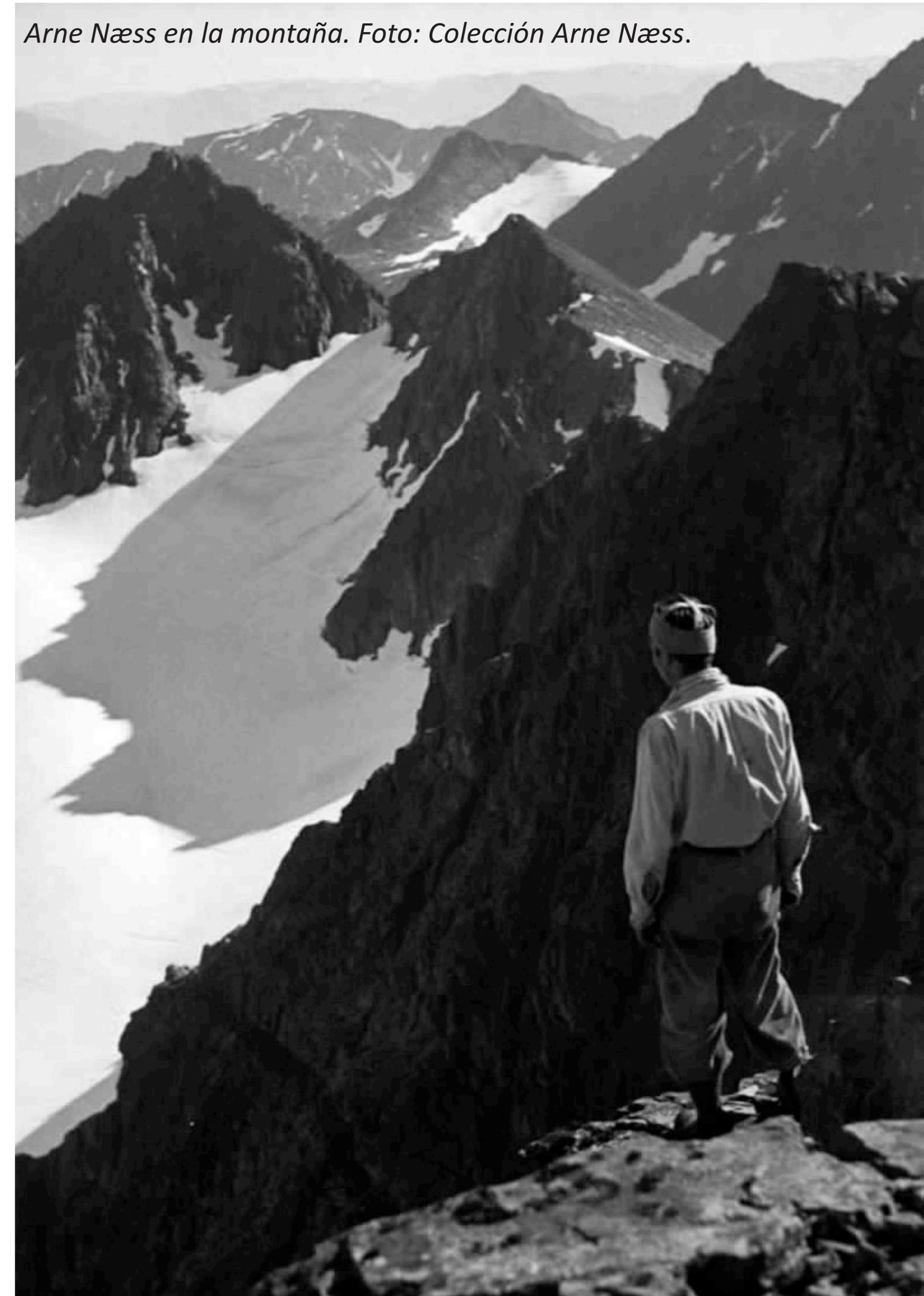
Arne Naess en la montaña.

RR: Para decirlo con mis propias palabras, "co-habitar", puesto que la conciencia del cohabitar implica el imperativo ético de cohabitar en la diversidad y la simbiosis.