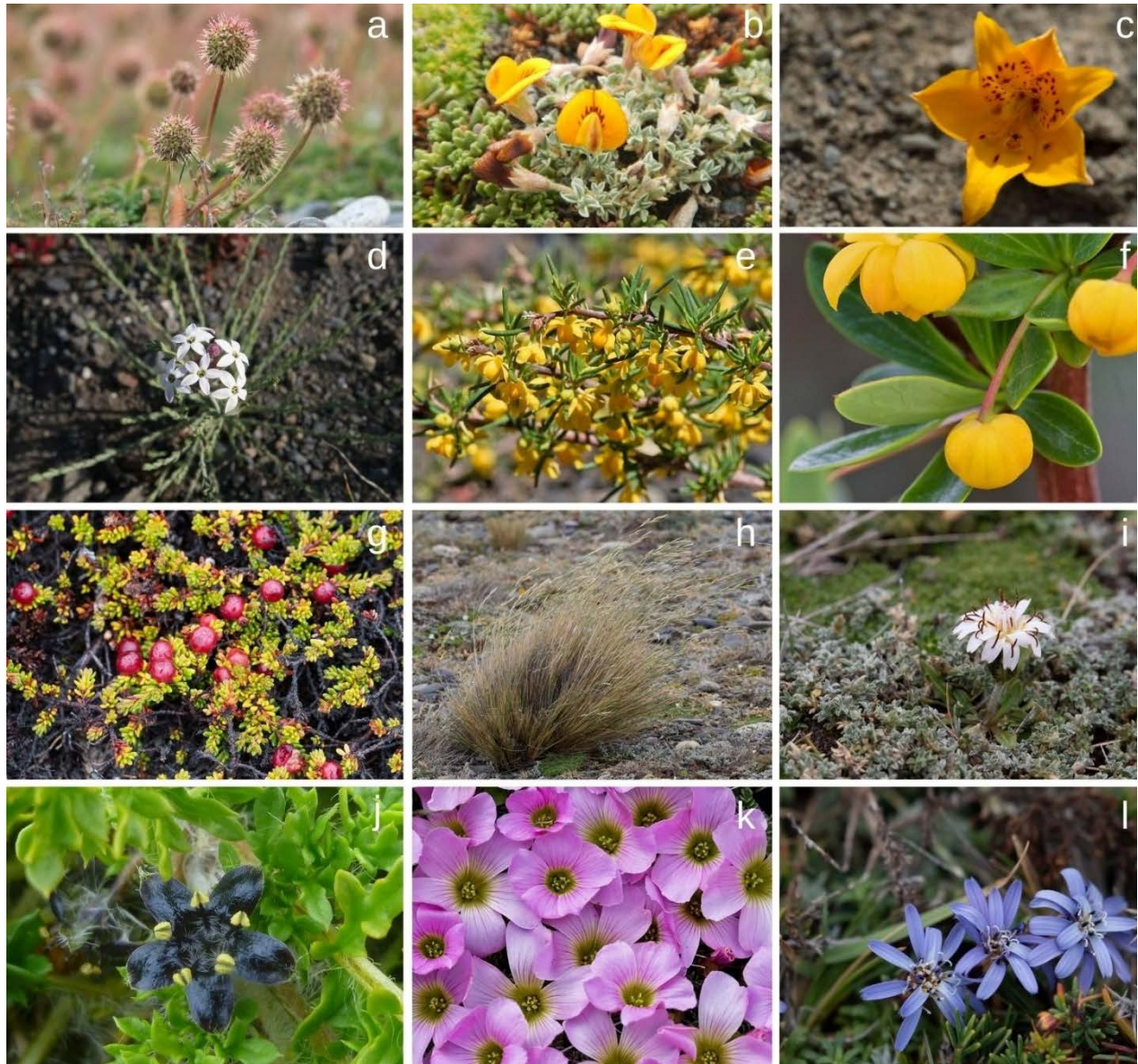
FIGURA 2. Plantas propuestas como flora carismática de la Reserva Natural Pingüino Rey (Tierra del Fuego, Chile). Para estas especies se seleccionaron criterios estéticos, etnobotánicos, fitoquímicos, distribucionales, ecológicos e históricos, para elaborar narrativas de interpretación de historia natural. Especies: a. Cadillo ( Acaena magellanica ); b. Adesmia gris ( Adesmia lotoides ); c. Amancay del desierto ( Alstroemeria patagonica ); d. Arjona ( Arjona patagonica ); e. Calafate enano ( Berberis empetrifolia ); f. Calafate ( Berberis microphylla ); g. Murtilla de Magallanes ( Empetrum rubrum ); h. Coirón ( Festuca gracillima ); i. Blanquita ( Hypochaeris incana ); j. Tomate negro ( Jaborosa magellanica ); k. Ojos de agua ( Oxalis enneaphylla ); l. Estrellita ( Perezia recurvata ). / Plants proposed as charismatic flora of the King Penguin Nature Reserve (Tierra del Fuego, Chile). For these species, aesthetic, ethnobotanical, phytochemical, distributional, ecological, historical and conservation criteria were selected to elaborate natural history interpretation narratives. Species: a. Cadillo ( Acaena magellanica ); b. Adesmia gris ( Adesmia lotoides ); c. Amancay del desierto ( Alstroemeria patagonica ); d. Arjona ( Arjona patagonica ); e. Calafate enano ( Berberis empetrifolia ); f. Calafate ( Berberis microphylla ); g. Murtilla de Magallanes ( Empetrum rubrum ); h. Coirón ( Festuca gracillima ); i. Blanquita ( Hypochaeris incana ); j. Tomate negro ( Jaborosa magellanica ); k. Ojos de agua ( Oxalis enneaphylla ); l. Estrellita ( Perezia recurvata ).